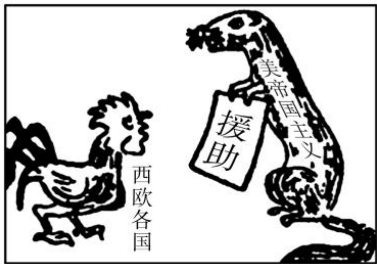
图一 漫画家华君武1947年的作品《黄鼠狼给鸡拜年》黄鼠狼身上的文字为“美帝国主义”