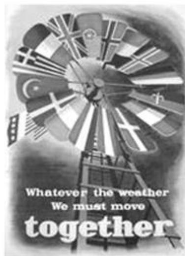
图二 20世纪50年代法国的宣传画，画中的英、法、德等国国旗排成一个风车状，英文意思为：“无论在任何恶劣天气下，我们会共同向前走。”