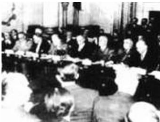
《北大西洋公约》签字仪式