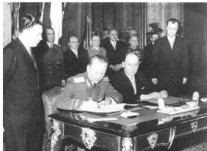
《华沙条约》签字仪式